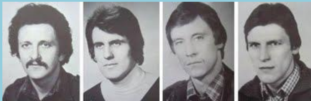
Drużyna florecistów z Igrzysk Olimpijskich w Moskwie w 1980 roku. Od lewej: Lech Koziejowski, Adam Robak, Marian Sypniewski, Bogusław Zych.

W 1980 z Igrzysk Olimpijskich w Moskwie przywiózł brązowy medal w turnieju drużynowym floretu wywalczony razem z Adamem Robakiem, Bogusławem Zychem i Marianem Sypniewskim.